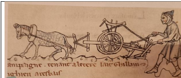
a La charrue