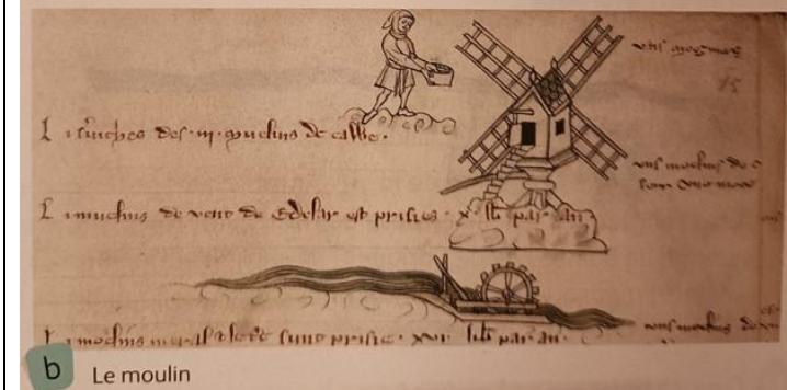
b Le moulin